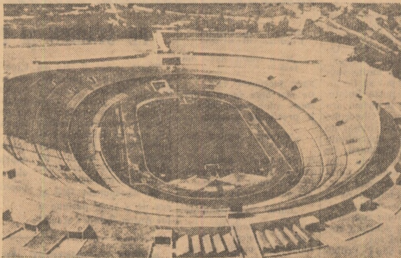
CIUDAD DE MEXICO. Vedere de ansamblu a stadionului din Cetatea Universitară