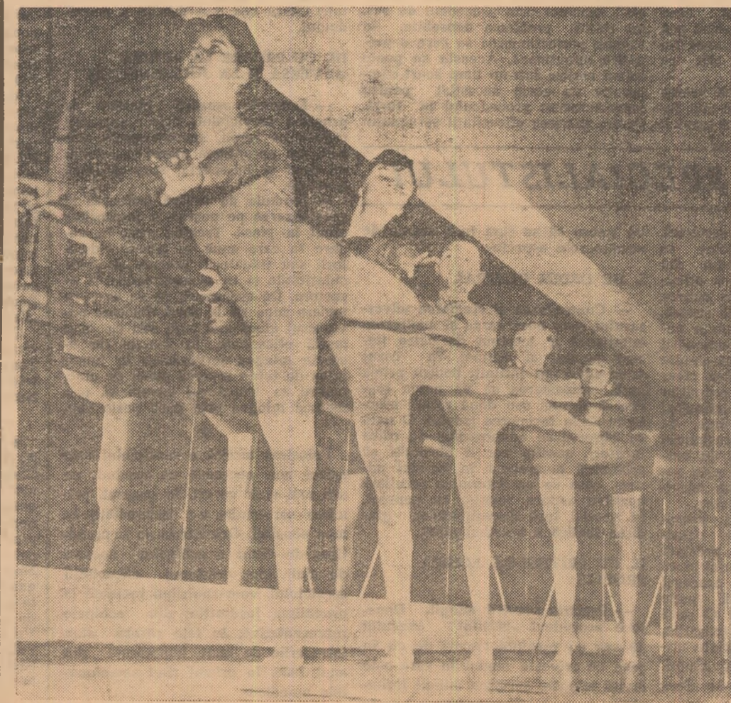
Simetrie și grație...