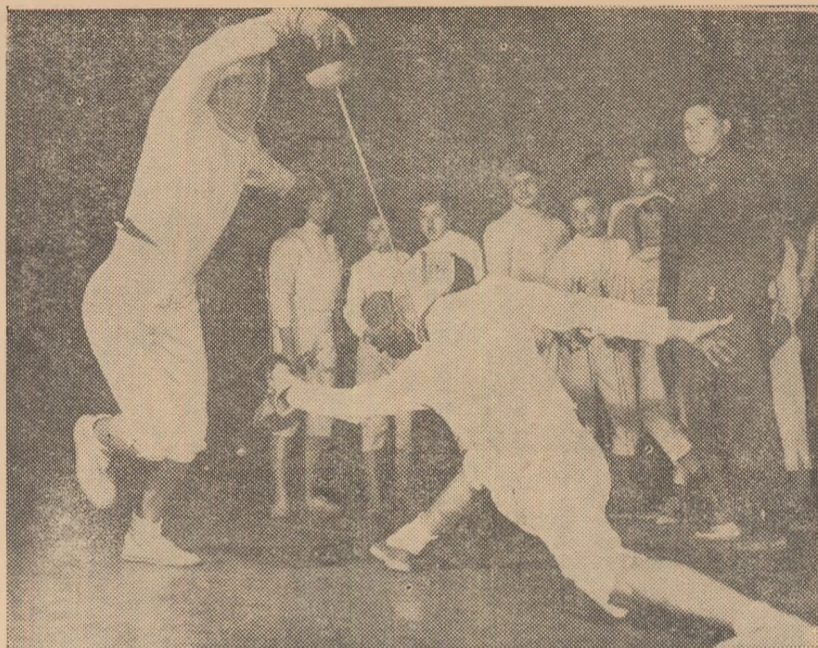
Scrima sport tot mai îndrăgii de tinerii craioveni. În fotografie, aspect de la antrenamentul scrimierilor de la Electroputere

Așadar, cum au muncit în 1965 activiștii sportivi, antrenorii și sportivii acestei regiuni pentru ca valoarea performanțelor să crească la nivelul cerințelor actuale?