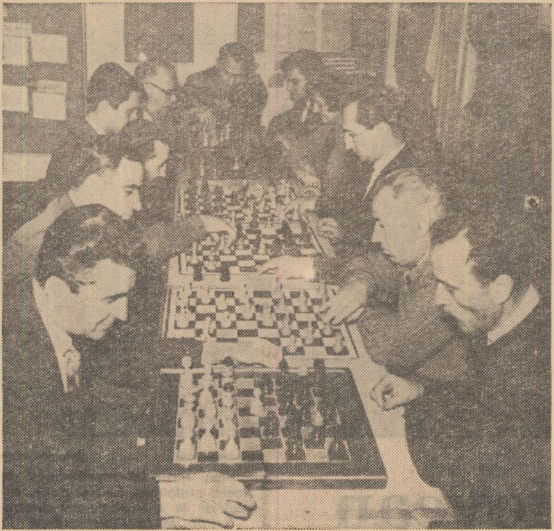
La Institutul de Studii și Prospecțiuni din Capitală au început concursurile Spartachiadei de iarnă. Iată șahiștii în întrecere