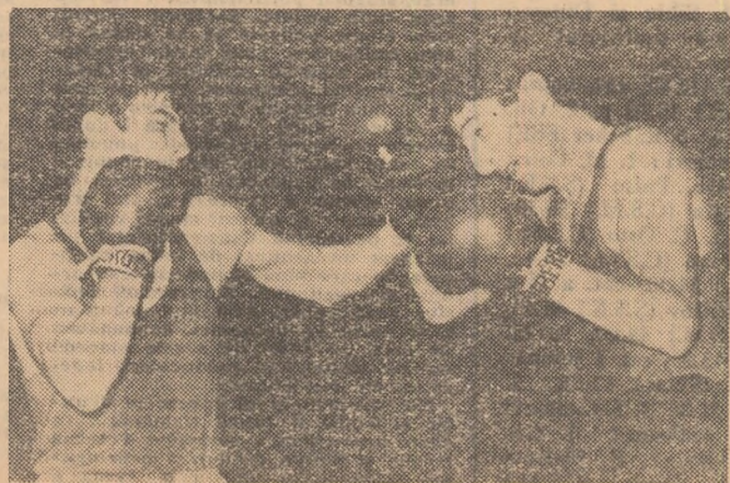
Fotoreporterul nostru, V. BAGEAC, a surprins unul dintre puținele „schimburi” clare în partida Stanef-Iliescu

Și prefer schiul deși o dată cu el am îndrăgît și am practicat cu toată pasiune de care este în stare tineretea, alte sporturi: baschetul, atletismul, handbalul. Împrejurările au făcut chiar ca baschetul să fie pentru mine (timp de un deceniu și jumătate) sportul nr. 1, sportul de performanță căruia i-am acordat aproape tot timpul liber și care mi-a adus și satisfacția rezultatelor ce încîntă și stimulează pe fiecare sportiv prins în pasionanta înclăștare a întrecerilor. Totuși, și în acest timp am cochetat cu alte sporturi; am continuat să schiez, să încalț pantofii cu cuie ai atletismului, am jucat handbal, am făcut cunoștință cu balonul oval sau mi-am încercat îndemînarea în minuirea crosei. Oricare din aceste sporturi m-ar fi putut cuceri. Fie-