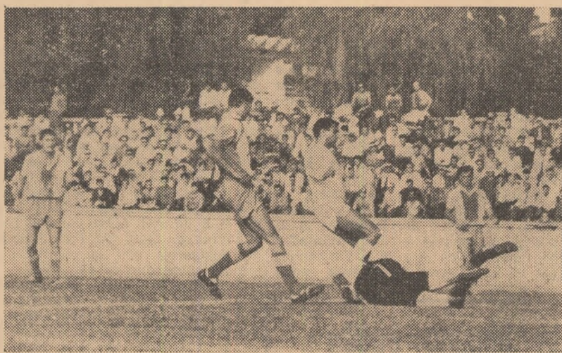
Fază dintr-un meci de fotbal susținut de echipa Progresul București în compania Științei București

— Același timp — în care sînt posibile noi acumulări — vă stă și dv. la dispoziție. — Firește. De altfel mi-am și schițat