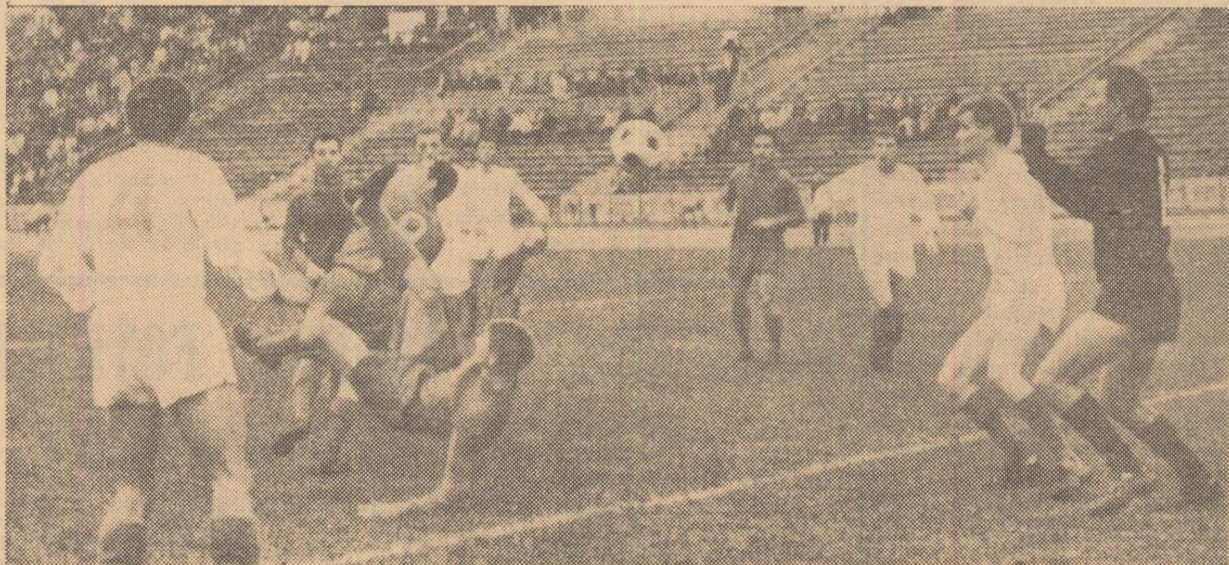
Momente critice la poarta Crișului. Fază din meciul Dinamo București — Crișul, disputat în toamnă pe stadionul „23 August”