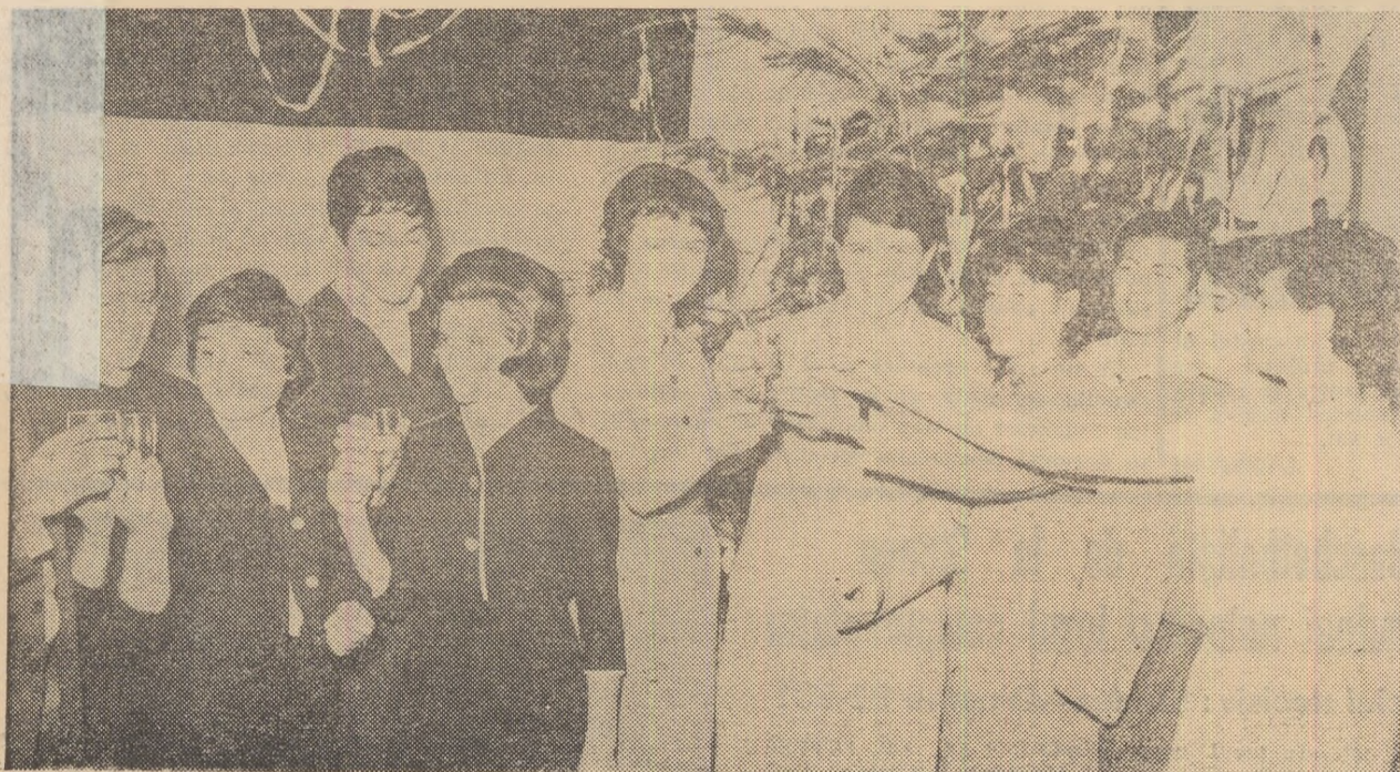
Tinerele speranțe ale sportului nostru își urează noi succese. În centru, campioana olimpică Mihaela Penes zîmbește promișând noi victorii