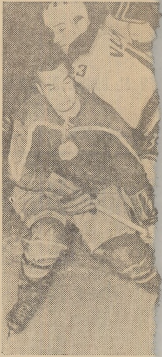
Dinamismul și frumusețea ilustrate de această fază a jocului în timpul unui meci.

Echipele participante sînt așteptate să seosească la Miercurea Ciuc în