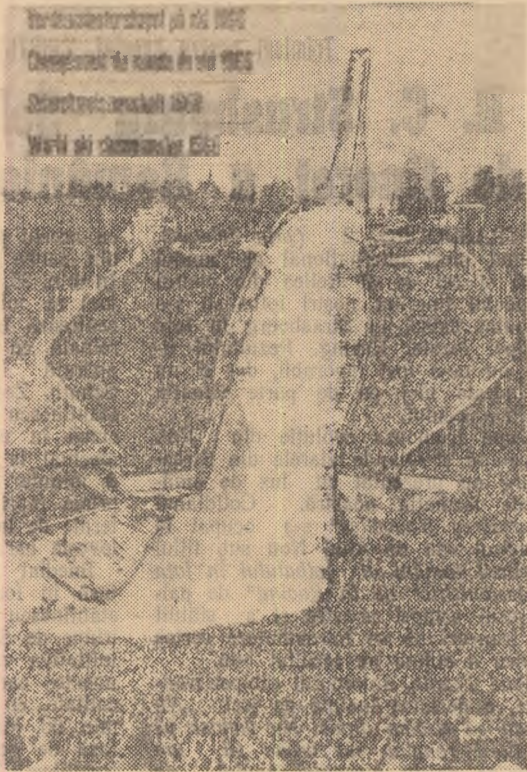
Alțișul campionatelor mondiale de schi (probe nordice)

Anul 1966 va constitui o etapă importantă în pregătirea și verificarea sportivilor pentru Jocurile Olimpice din 1968, de la Ciudad de Mexico și Grenoble.