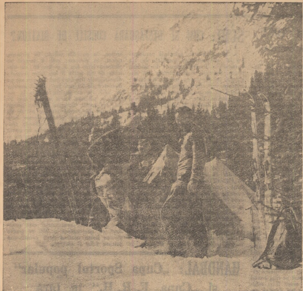
Iarna în Retezat...

Anul XXII — Nr. 4862 * Joi 6 ianuarie 1966 * 4 pagini 25 bani