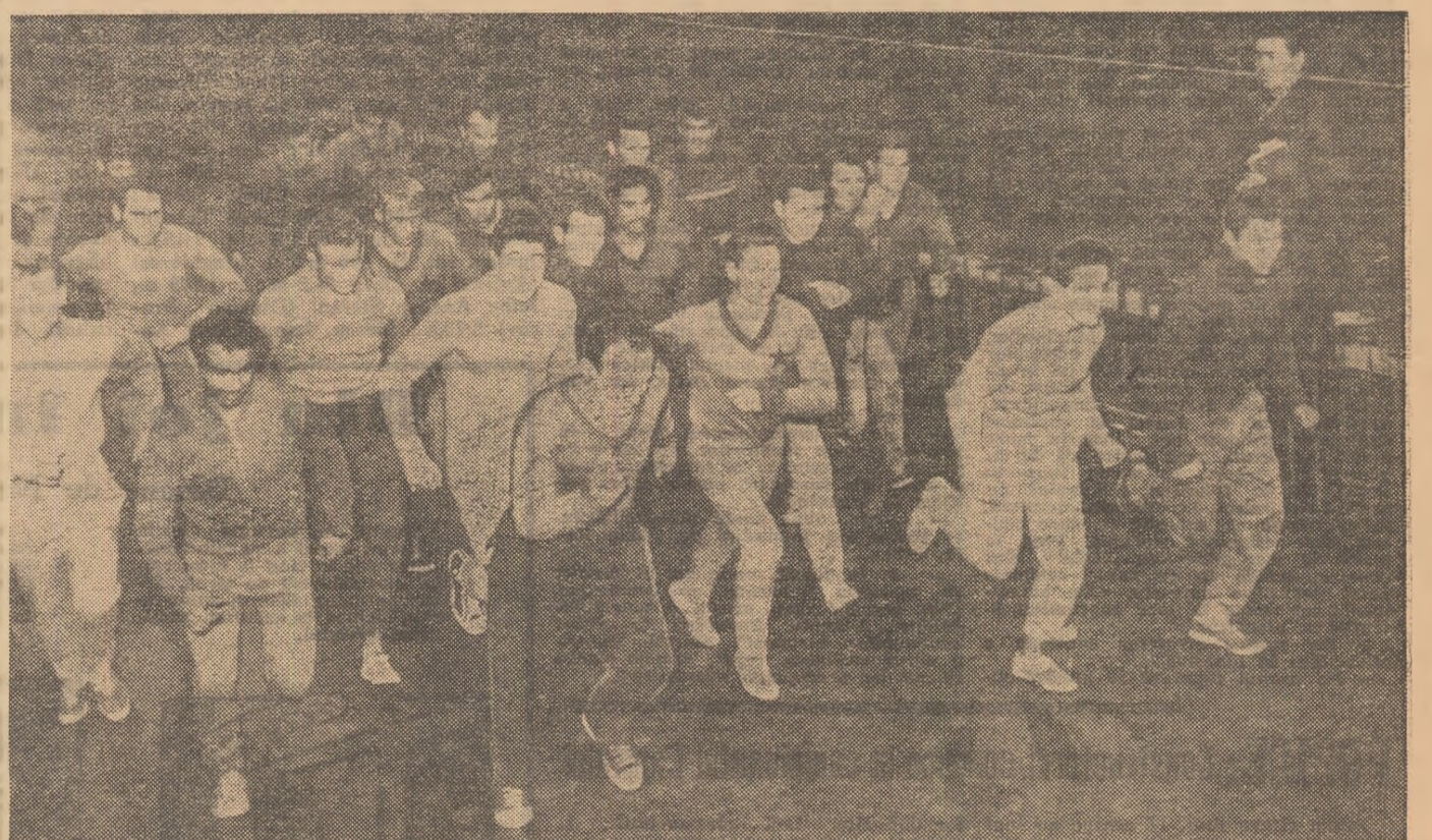
Pentru a apăra prestigiul caiacului și canoelii românești, sportivii noștri se pregătesc cu seriozitate. În imaginea noastră: sportivii clubului Steaua își trec probele de control. Ei au luat startul, ca și colegii lor de la Dinamo, în lupta pentru ocuparea unui loc în echipa reprezentativă

Sportivii noștri în fața unui bogat program internațional