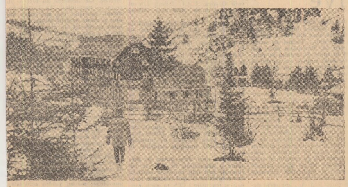
Complexul turistic Borșa