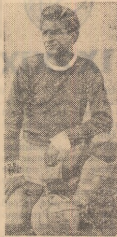
La victoriile echipei Manchester United a contribuit — firește — și unul din cei mai buni atacanți ai săi: Denis Law.

Învîngînd cu 5—1 pe Tottenham, echipa Manchester United a obținut cea de-a 400-a victorie din cele 819 întîlniri susținute de acest club în ultimii 20 de ani. În cursul acestor întîlniri au fost realizate 192 meciuri nule. De 227 ori Manchester a părăsit terenul învinsă. Fotbaliștii englezi au înscris în această perioadă 1652 goluri și au primit 1174. În ultimii 20 de ani, Manchester a beneficiat de serviciile unui singur antrenor: Matt Busby.