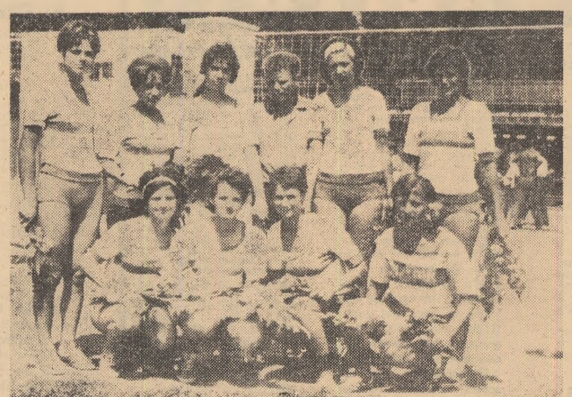
Junioarele de la Meteor Brașov, după finala de la Timișoara, din 1965, cînd au cucerit pentru a treia oară titlul de campioane

Echipa divizionară masculină de volei Știința Galați, invitată de către Federația franceză, a acceptat să participe la un turneu care se va desfășura în zilele de 8—10 februarie la Paris. La competiție vor lua parte trei echipe franceze, și anume: selecționata de tineret a țării și două echipe de club încă nedesemnate.