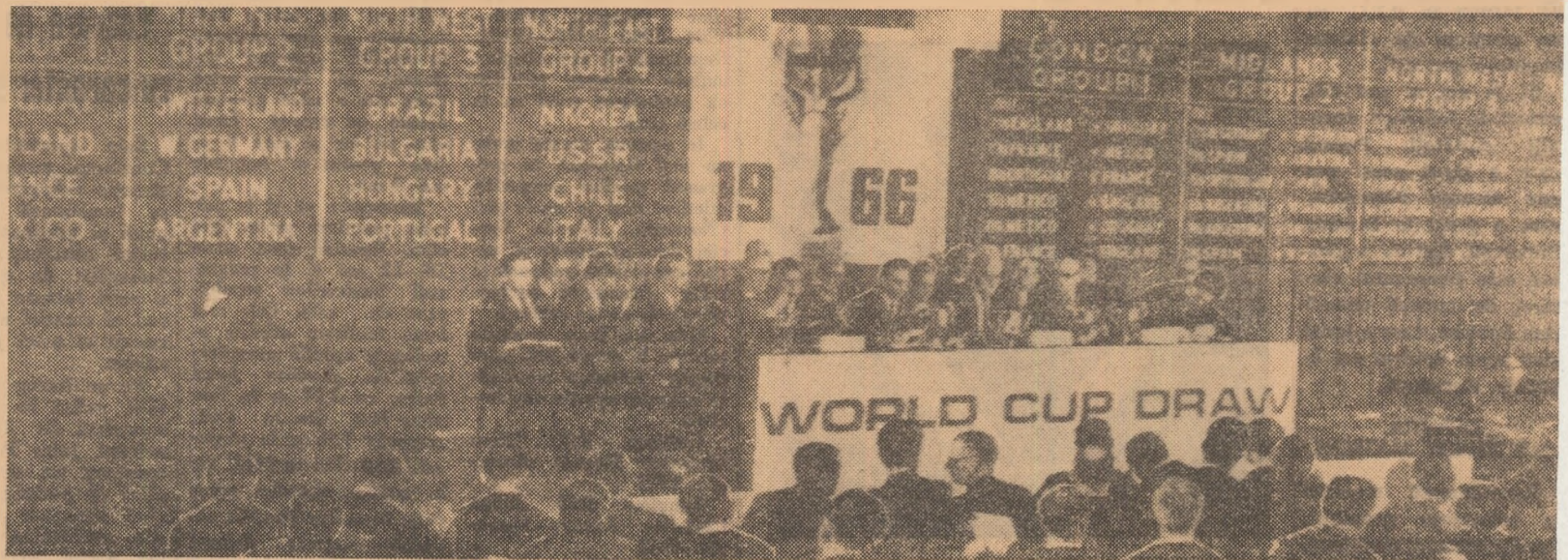
Un instantaneu în timpul tragerii la sorți. Pe tablele din spatele juriului sînt afișate cele patru grupe (stînga) și meciurile din optimile de finală (dreapta).