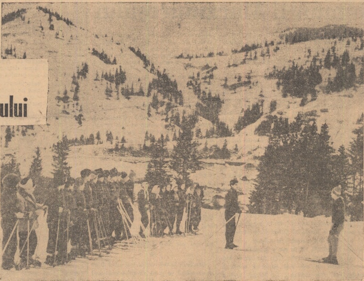
La prima oră, raportul prezentat de elevul de serviciu, după care instructorul va explica teoretic lecția ce va fi executată în cadrul decorului minunat al complexului turistic Borșa

Pentru băimăreni a devenit ceva obișnuit să vadă zi de zi pe Dealul Florilor copii învățînd să schieze. Ei nu vor fi lipsiți nici acum de acest spectacol atrăgător (pentru că e foarte plăcut să-i vezi pe micuți cum, după cîteva lecții, luncă cu temeritate pe schiuri) deoarece, ca în fiecare sezon, co-