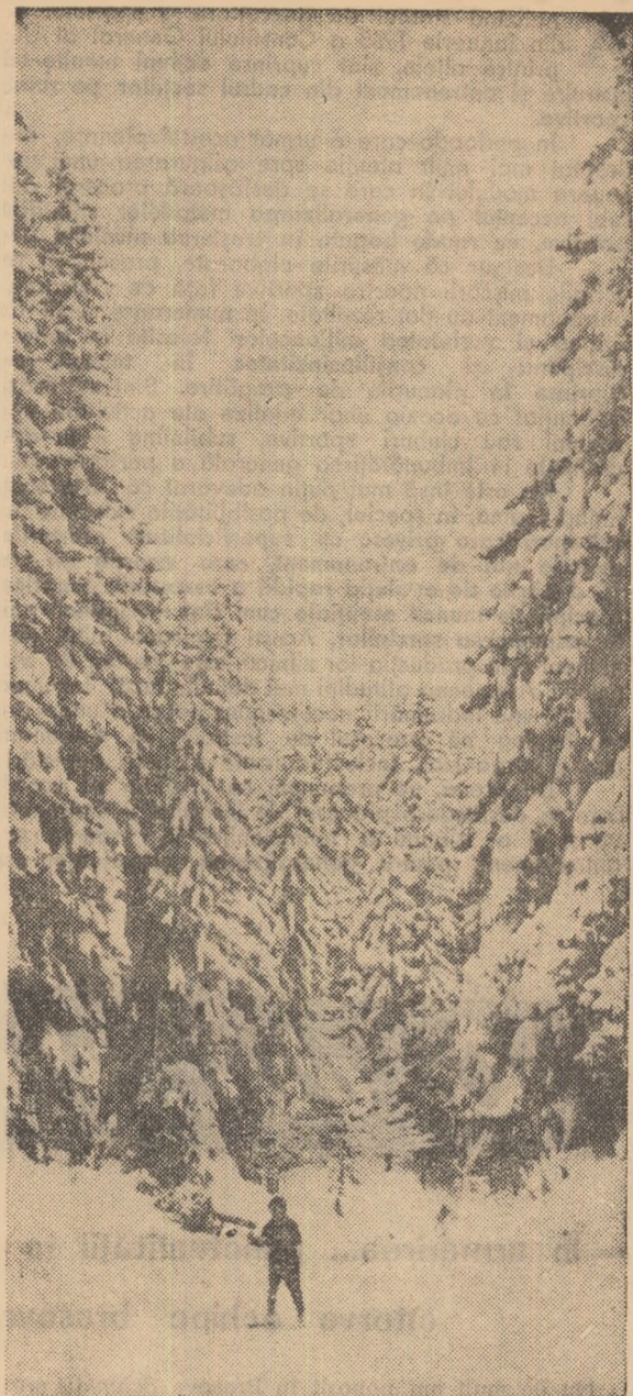
leri, la Predeal

Va urma apoi o gală de filme din cinemateca centrului de documentare „23 August”: „Greșeli și inco-