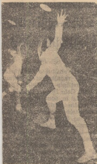
Un moment din întrecerea floretistilor...

Sîmbătă și duminică, în la de sport a Facultății drept, a avut loc primul concurs oficial de rimă din acest an. Este vorba de întrecerile din cadrul campionatului de iarnă al Capitalei, cu participarea trăgătorilor de togoria a III-a și neclăcași la probele de floață băieți și spadă.