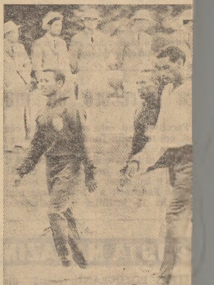
Sportivii etiopieni sînt printre cei mai maratonisți ai lumii. De la stînga dreapta: Dénissie Wolde, Mamo și dublul campion olimpic Bikila

La greutate, sud-africanul Botha (mulți ani cel mai bun de pe continent), a cedat înțietatea unui aruncător din Maroc, Akka (1,97 m și 120 kg), care a reușit 18,08 m. La disc și sulția cele mai bune performanțe sînt 54,45 m (Malan — Africa de Sud) și 71,52 m (Oyakhire—Nigeria). Atît la greutate cît și la disc, cea mai mare speranță este însă un tînăr de 18 ani cu un gabarit impresionant. Se numește Van Reenen, măsoară 2,02 m înălțime și cîntărește 116 kg.