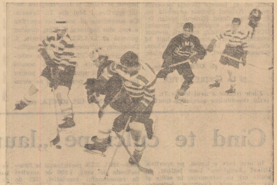
Paralel cu întrecerea juniorilor de cat. I, a avut loc și o competiție rezervată celor mai tineri hocheiști, din care vă prezentăm o imagine din meciul Dinamo și Olimpia

semnala că această întrecere nu s-a bucurat de condiții bune de desfășurare. La meciuri nu au fost asigurate cronometrele necesare, lotul de arbitri a fost de multe ori incomplet și nu s-au luat suficiente măsuri pentru ca jocurile să înceapă la timp, conform