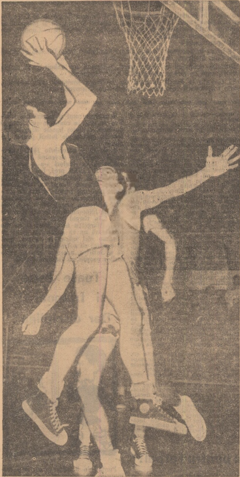
Imagine din ultimul meci Rapid — Dinamo București desfășurat în campionatul republican

Una din caracteristicile competițiilor de jocuri sportive organizate, pe plan republican, cu mai multe etape, este pauza dintre tur și retur. Se pare că această perioadă a fost inspirată tuturor jocurilor de către întrecerile de fotbal, care nu și puteau continua desfășurarea în timpul iernii. Am spus se pare, deoarece nu există indicații metodice precise care să demonstreze necesitatea întreruperii dintre turul și returul unei competiții. Desigur, se poate demonstra utilitatea întreruperii, dar aceasta nu are aceeași importanță pentru jocurile sportive care își desfășoară competițiile de bază în sală, ca și pentru jocurile practice numai în aer liber (fotbal, rugbi).