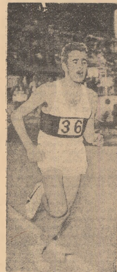
Atletului belgian Gaston Roelants i s-a omologat recordul mondial pe 3000 m obstacole