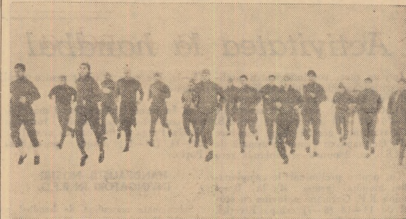
În fotografie: jucătorii de la Steaua au început încălzirea

Cel de al treilea antrenament din acest an al fotbalistilor de la Steaua a avut loc vineri pe terenul Ghencea.