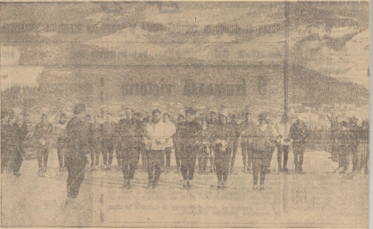
O imagine care se va reedita în curînd: studenții Institutului pedagogic din Iași gata să înceapă programul în tabăra organizată anul trecut în vacanță la Vatra Dornei