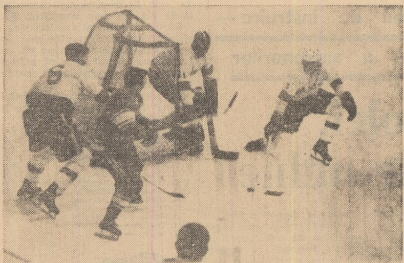
Fază din meciul de hochei U.R.S.S. — Canada disputat la Colorado Springs. După cum se știe, trofeul W. A. Brown, cu care a fost dotat turneul, a revenit echipei sovietice

MOSCOVA 17 (Agerpres). — În cadrul sferturilor de finală ale Cupei Europei la box (celipe de tineret), la Donețk s-a desfășurat meciul dintre selecționatele Franței și U.R.S.S. Victoria a revenit cu 8-2 boxerilor sovietici, care s-au calificat pentru semifinale, urmând să întâlnească echipa iugoslaviei.