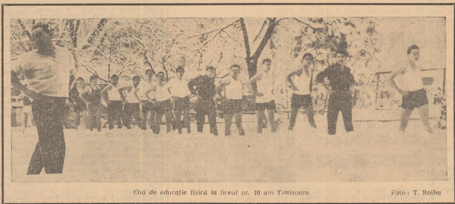
Oră de educație fizică la liceul nr. 10 din Timișoara