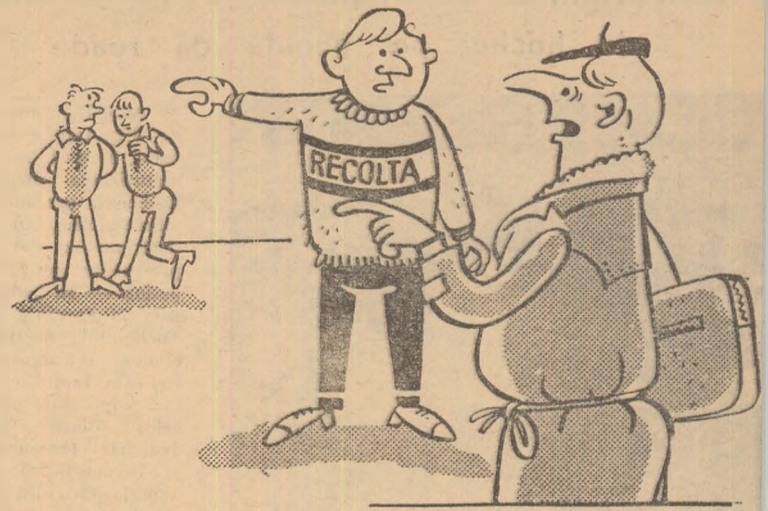
— Numai atît ? — Da ! — Slab... RECOLTA !