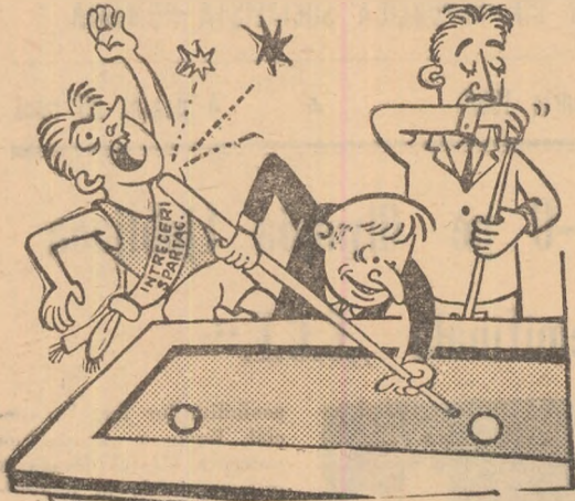
Cauză și... efect

În sala clubului asociației sportive Paringul Lonea se joacă tot timpul biliard și astfel sportivii n-au unde să se întrecă la trîntă, șah și tenis de masă.