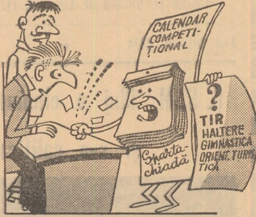
Calendarul: — La mine nu există Stintul... așteaptă!

În asociațiile sportive Voința Abram, Progresul Otomani, Voința Chiribiș și Recoleta Chiraleu din raionul Marghita întrecerile se organizează numai la șah și tenis de masă (I. Boi-toș-coresp.).