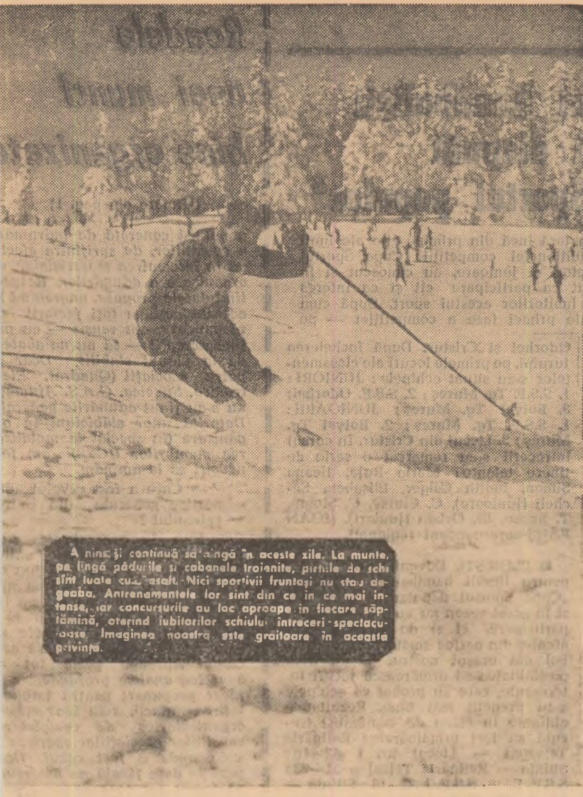
A ninsă continuă să aungă în aceste zile. La munte, pe lângă pădușile și cabanele troianite, pirițele de schi sînt foarte cunoscute. Nici sportivii frunziși nu stau degeaba. Antrenamentele lor sînt din ce în ce mai intense, iar concursurile au loc aproape în fiecare săptămînă, oferind iubitorilor schiului intrarea în spectaculoasă imaginea noastră este grațioasă în această privință.