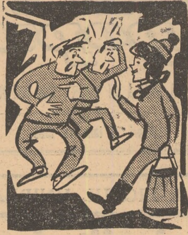
— Grăbește-te! A început meciul. Portarul: Las'că noi jucăm handbal și în șase.