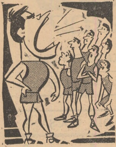
— Ia uitați-vă la el, „jumate” dar face gura cîl șapte.