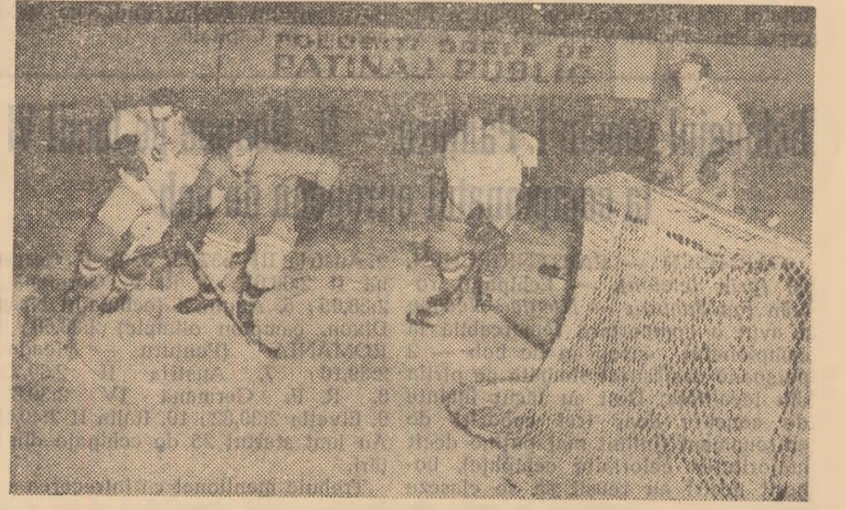
Fază din meciul Dinamo București — Știința Cluj, disputat în cadrul campionatului pe patinoarul artificial „23 August”.

Voința Miercurea Ciuc. De această dată întîlnirea promite să fie și mai atractivă, deoarece — după victoria dinamoviștilor asupra echipei Steaua — atît Dinamo, cît și Voința sînt în cursă directă pentru ocuparea locului secund. Este, am putea spune, cel mai interesant joc al acestui ultim tur al campionatului și în cazul cînd