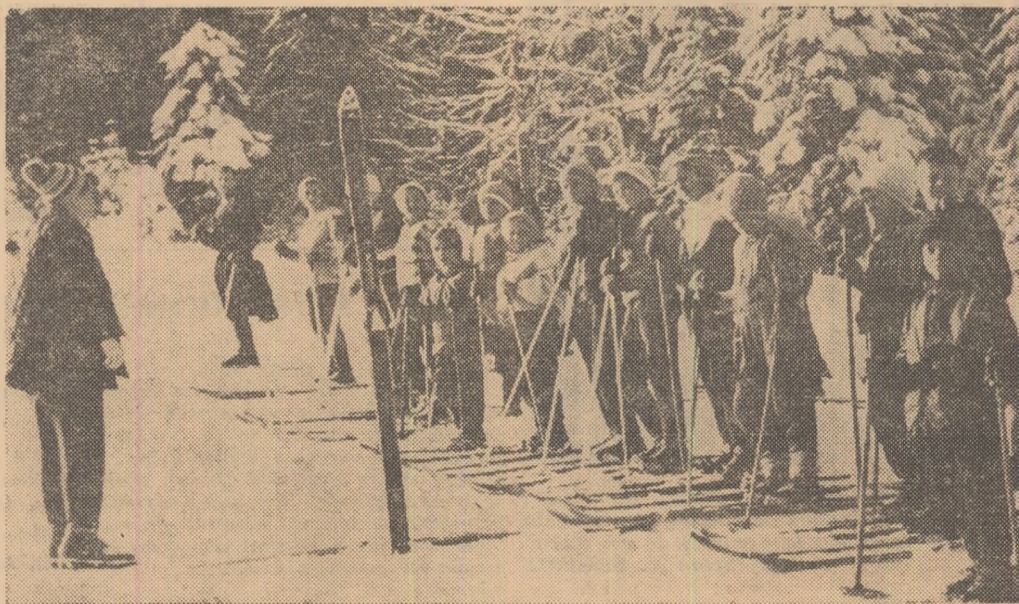
La fiecare sfîrșit de săptămînă poate fi văzut la Predeal, pe Clăbucet, un grup de circa 40 de copii participînd la lecții de schi. Este vorba de micuții schiori de la S.S.E. nr. 2 București

LA STRAJA ȘI PĂLTINIȘ, ALTE IMPORTANTE CONCURSURI