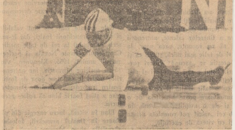
O cădere care l-a costat pe campionul mondial de patinaj viteză P. Ivar Moe (Norvegia) secunde prețioase în campionatul european desfășurat recent la Deventer în Olanda. De altfel, după această primă cădere Per Ivar Moe a mai căzut o dată în cursa pe 5.000 metri, ieșînd complet din lupta pentru titlu.

deținut de Bob Pettit din St. Louis cu 20.800 coșuri marcate! Pentru a obține acest record, Pettit a susținut 792 partide în 11 ani, în timp ce Chamberlain a reușit această performanță în numai 499 jocuri în decurs de 6 ani.