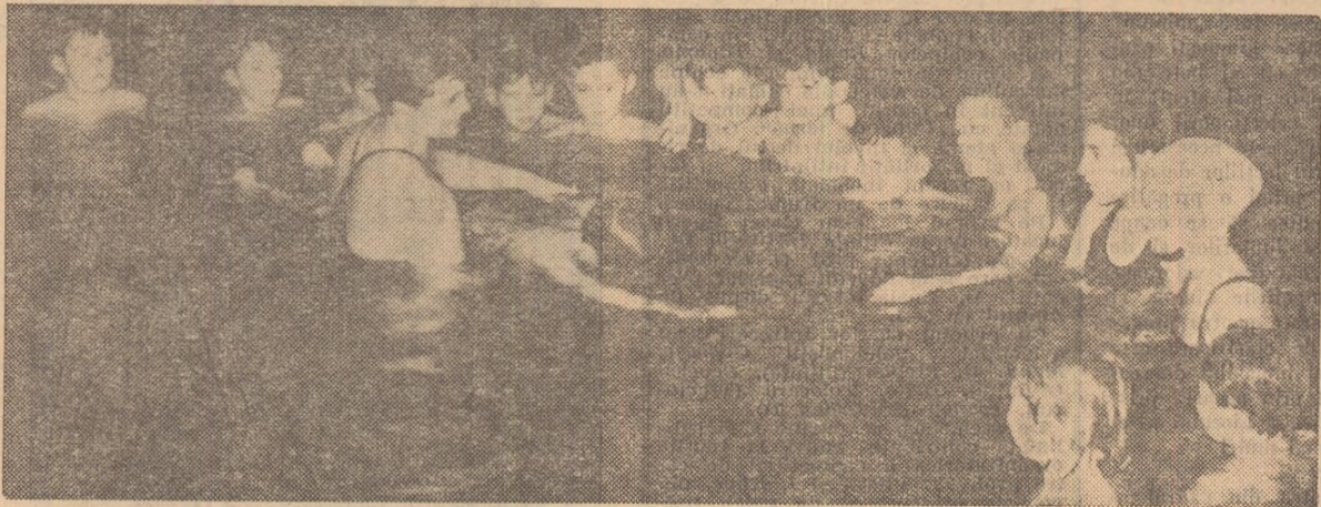
Activitatea la natație nu conținește la Timișoara nici în timpul iernii. Numeroși copii vin la bazinul acoperit pentru a descifra tainele inotului. Iată un grup dintre aceștia, urmărind cu atenție sfaturile instructorului sportiv

Anul XXII—Nr. 4885 ★ Miercuri 2 februarie 1966 ★ 4 pagini 25 bani