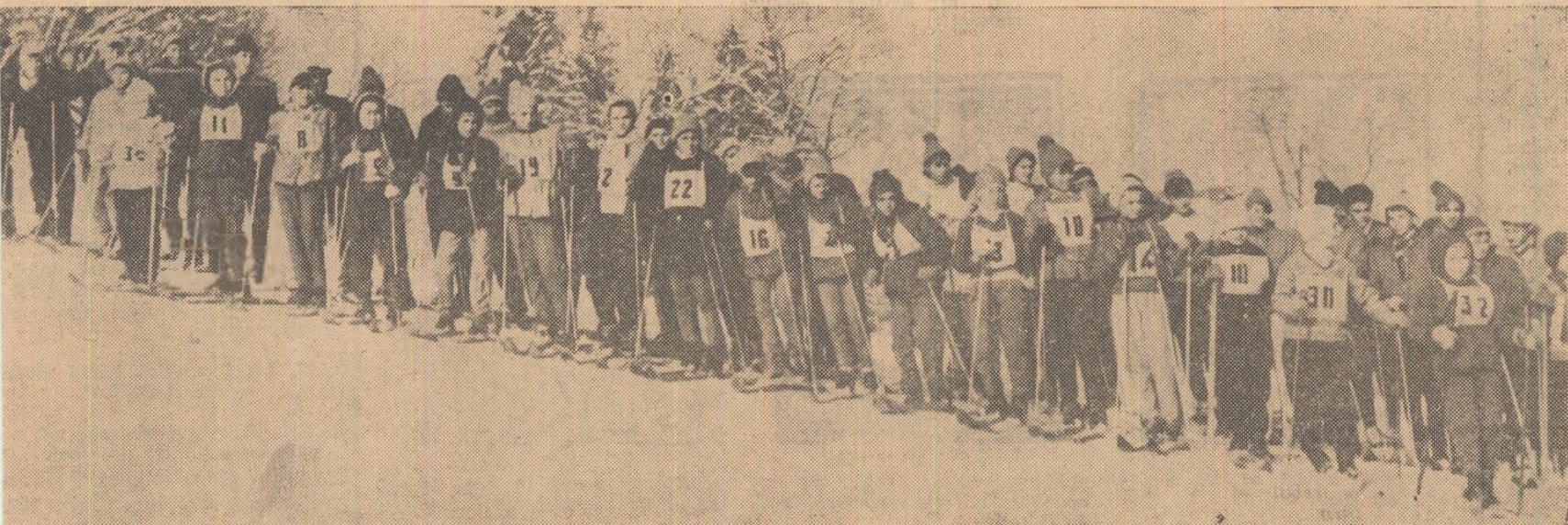
de naștere... fotografic al unei noi generații de schiori