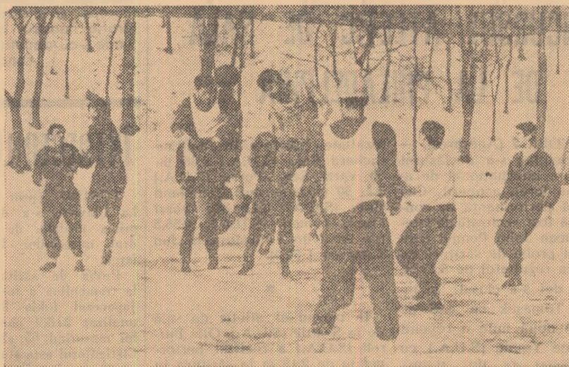
Buna dispoziție, vioiciunea, pofta de joc — domnesc la antrenamentele echipei Dinamo Victoria din București, care activează în categoria B.