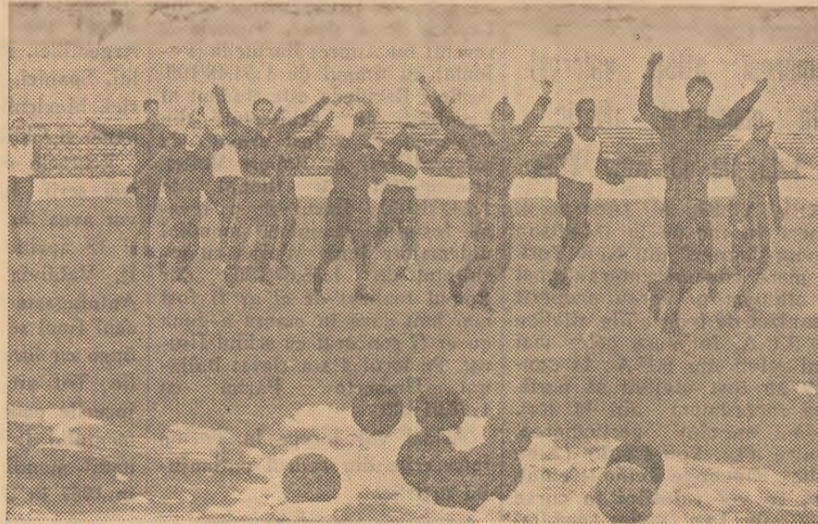
Fotbaliștii de la Progresul se antrenează de zor. E și normal: returul nu e prea departe și nici... categoria A în care bucureștenii au șanse serioase să revină. O bună pregătire constituie o șansă în plus.