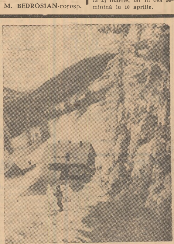
Cabana Diham, în fermecătorul ei decor de iarnă. Acum, ea este „refugiul” drag al multor studenți aflați în vacanță. Excursiile, jocurile de cabană, coborârile vertiginose pe schi sunt, desigur, binevenite după o sesiune de examene.

Returul campionatului republican la categoria A în seria I va începe la 20 februarie pentru echipele masculine și la 27 februarie pentru cele feminine. Intrecerea din seria a II-a masculină va fi reluată la 27 martie, iar în cea feminină la 10 aprilie.