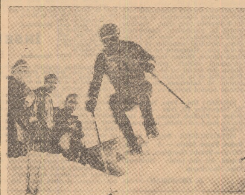
Schiorul austriac Karl Schranz s-a dovedit pînă acum cel mai bun dintre specialiștii probelor de coborîre. Iată-l în timpul concursului de la Wengen (Elveția) unde a cîștigat pentru a treia oară coborîrea

OSLO 10 (prin telefon). — Campionatele internaționale de tenis pe teren acoperit ale Norvegiei au continuat cu disputarea sferturilor de finală la dublu masculin.