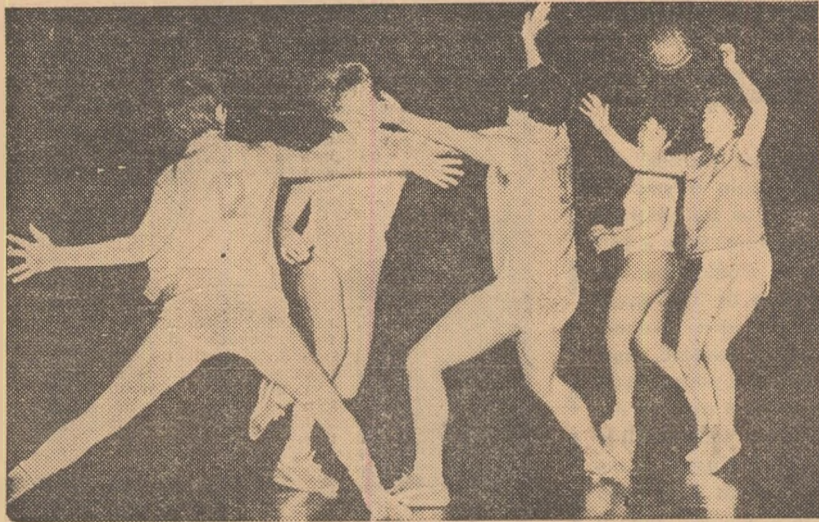
DUMINICĂ — NICI UN MECI FEMININ ÎN CAPITALĂ... Penultima etapă a turului campionatului republican se desfășoară exclusiv în țară. Și sînt programate meciuri extrem de importante, printre care Știința Timișoara — Știința București și Mureșul Tg. Mureș — Rapid București. În fotografie: aspect din derbyul bucureștean Știința — Rapid.

Oare este așa de greu pentru unii să respecte regulamentul? (p. g.)