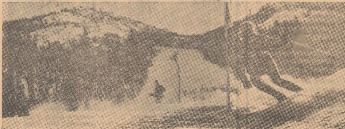
Dinamism, vigoare, sănătate — toate își dau întâlnire pe pîrțile albe. Nu veniți și dumneavoastră?