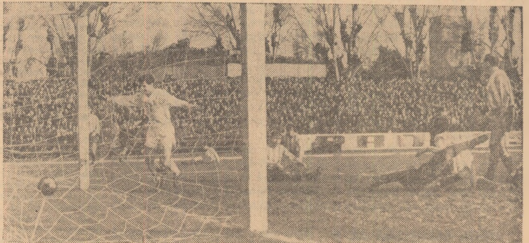
Al patrulea gol și... al treilea meci. Fotbaliștii spanioli privesc consternați mingea expedită în plasă de Goran.

— Sortii au decis: al treilea joc, tot la Brașov —