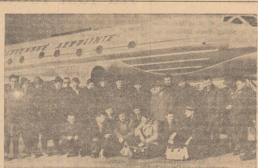
Echipa Spartak Plsen la sosirea pe aeroportul Băneasa