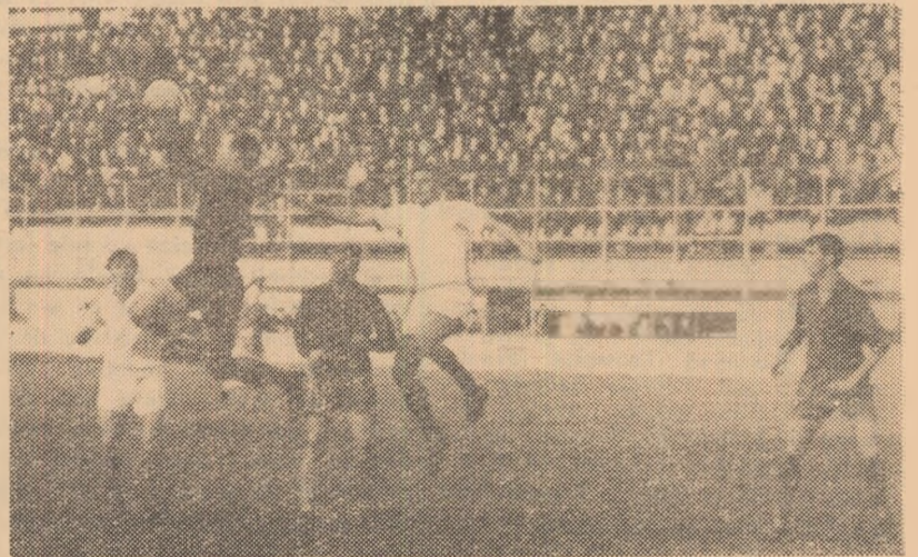
Una din numeroasele intervenții ale portarului Ghibănescu (Dinamo Victoria)