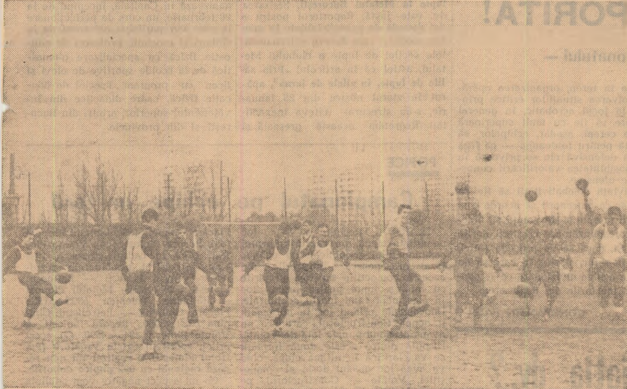
„Controlul balonului” în execuția fotbaliștilor de la Metalurgistul București, la antrenamentul de joi

Antrenorul P. Rădulescu ne-a declarat că toți componenții echipei sint hotărîți