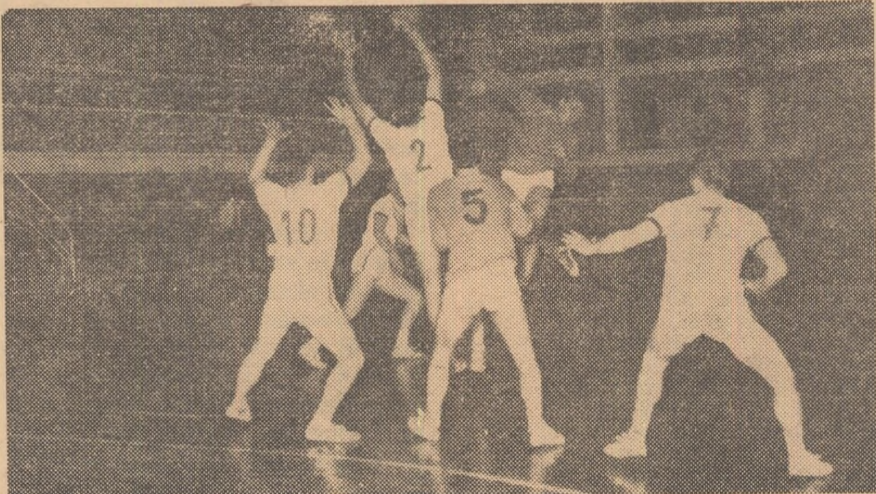
Un nou atac al Ralinăriei care va străpunge apărarea handbaliștilor de la Magdeburg

Întrecerile continuă azi și se încheie mîine. (p. g.)