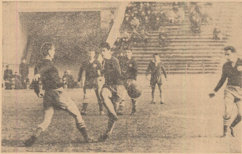
O imagine cu o vechime de un an, de pe vremea cînd Minerul se afla în categoria A. Pe cînd revenirea echipei bîimărene în plutonul celor mai bune țara noastră?

cîștigă forța șuturilor care peste o lună vor însemna goluri.