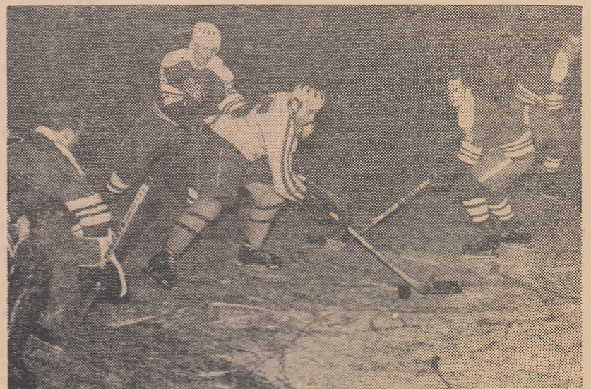
Szabo II se descurcă bine, deși îl încadrează 3 jucători de cîmp finlandezi și portarul...