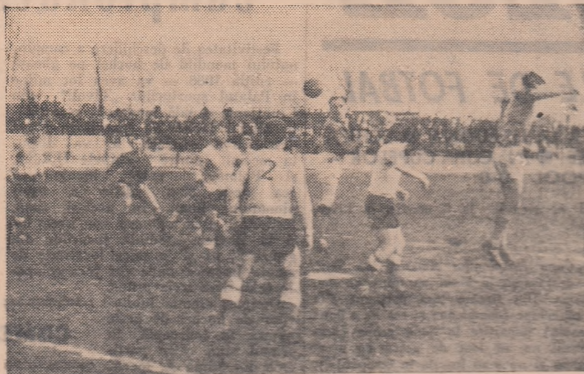
Faza percutantă la parca fotbalistilor din Medgidia în meciul Farul Constanța - I.M.U. Medgidia.

nemulțumirea jucătorilor buhușeni. Ei s-au enervat și au prestat, în continuare, un joc cu multe durități de pe urma căruia a avut de suferit spectacolul fotbalistic. (C. Nemțeanu — corespondent).