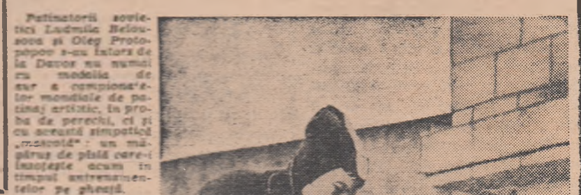
Patinoarii sovietici Ludmila Belousova și Oleg Protopopov s-au întors de la Denver cu medalia de aur a campionatelor mondiale de patinaj artistic, în proba de perechi, și cu această simțită „medalia” — un mășur de plată care-i însoțește acum în timpul antrenamentelor pe gheață.

După cum se vede, sportivii noștri fruntași au, în așteptarea campionatelor mondiale, un bogat program internațional, în urma căruia vor fi alecătuite cele două formații care se vor reprezenta la cea mai mare competiție de popice din lume.