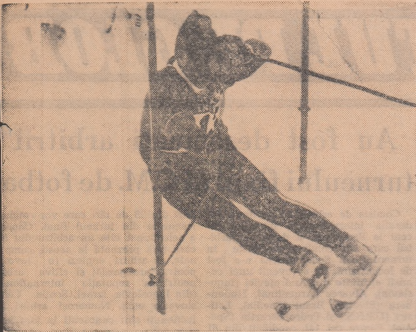
Karl Schranz, unul dintre cele mai bune „produse“ ale școlii austriece de schi