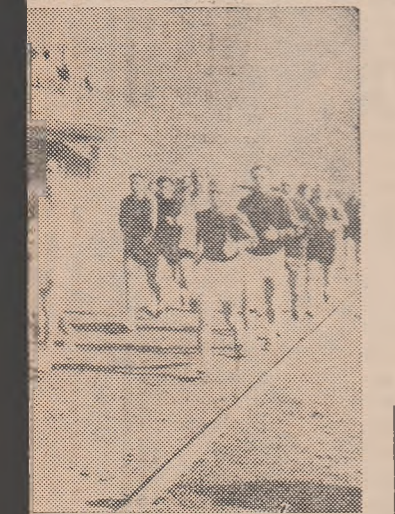
Arbitri ploieșteni pe pista stadionului în timpul probelor atletice de control.

Arbitrii de a avea o comportare cât mai bună în noul sezon fotbalistic.