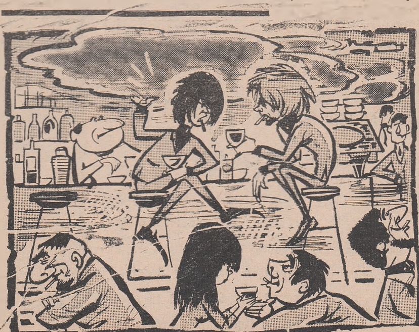
De educație fizică îmi arde mie? Nu vezi ce am pe cap? Desen de Neagu Rădulescu

după efectuarea practicii și a lecțiilor — o oră sau chiar mai mult pentru sport. Acest orizont larg de vederi al cadrelor didactice a favorizat