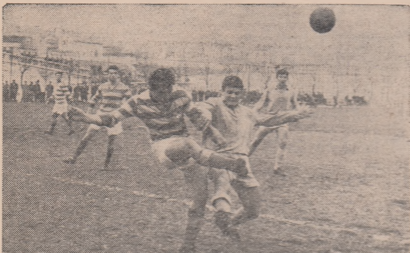
Fază din meciul Dinamo Victoria București — C.F.R. Roșiori. (0-0) disputat joi în Capitală.