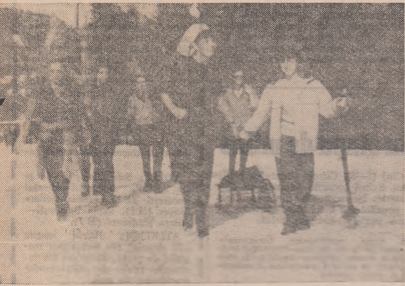
În drum spre Hotelul Alpin de la Cota 1400

Să le urăm elevilor sportivi succes în întrecerile la care vor lua parte și o vacanță cît mai frumoasă!