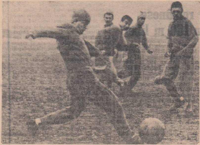
Antrenament la echipa Steaua