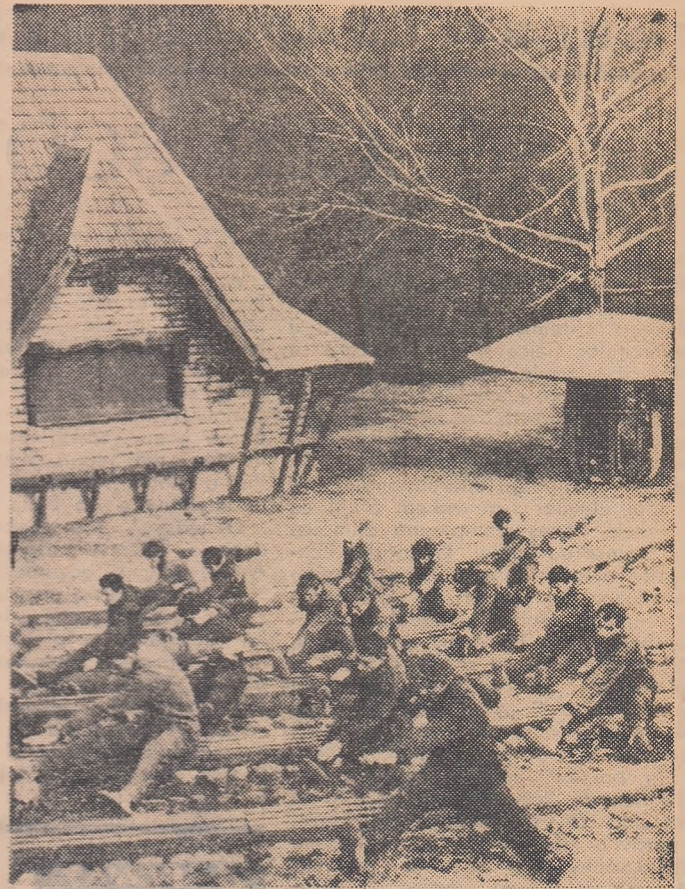
După campionatele de schi