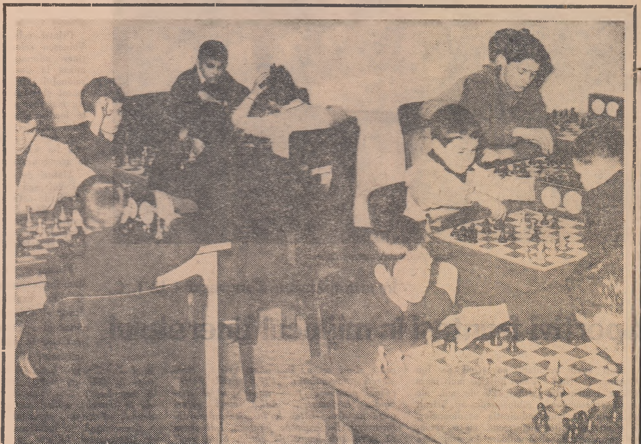
La clubul Voința din Capitală funcționează un centru de inițiere în șah pentru copii. După audierea lecțiilor teoretice elevii exemplifică la tablă cele învățate. Rezultatele sînt foarte promițătoare: 20 de mici jucători au și obținut clasificarea sportivă.