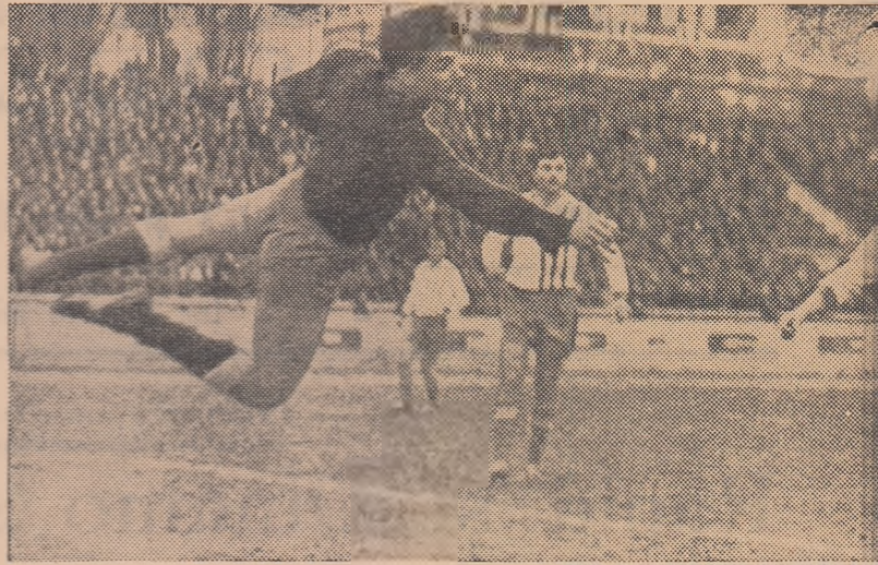
O minge și... patru apărători gălățeni care o privesc cu teamă. (Fază din rurgistul)