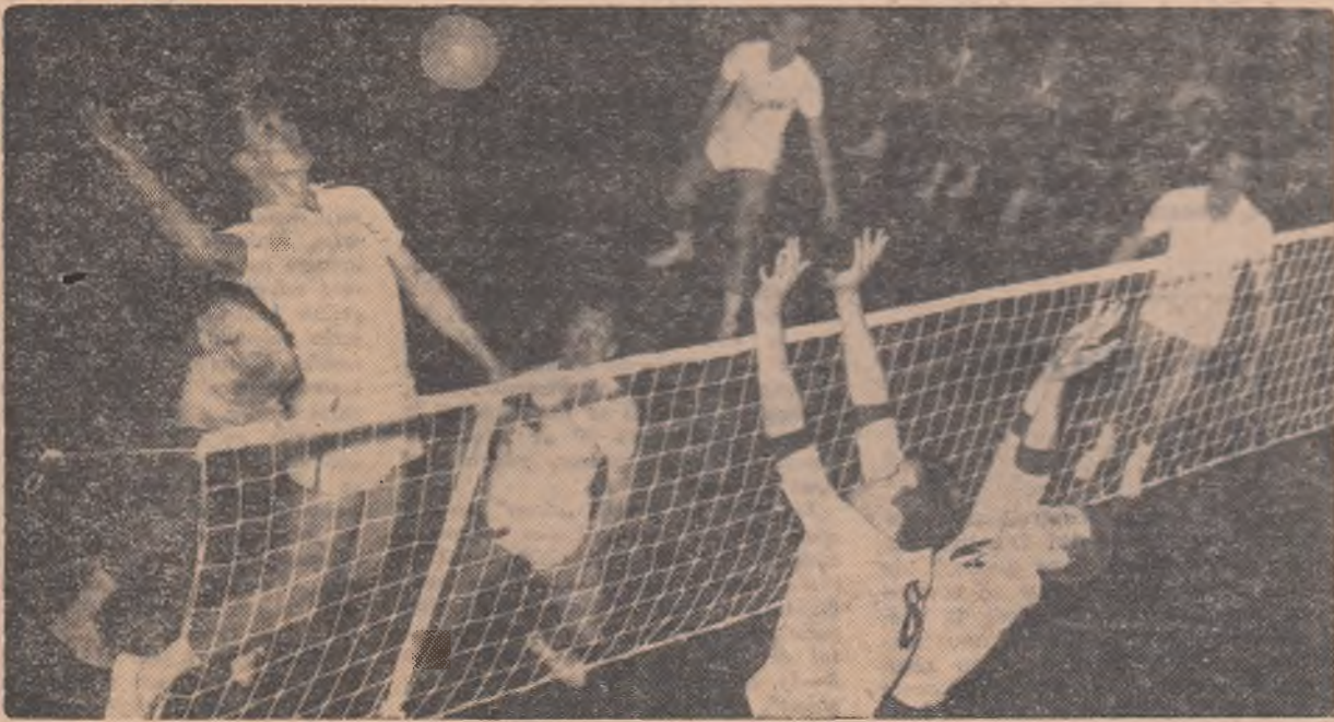
Dinamistul Tirlici, în atac, va ieși învingător din lupta cu blocajul echipei Pernik (B. Ghiudero — Koritarov)

● SÂMBĂTĂ, LA BUCUREȘTI: DINAMO — PERNIK 3-0 ● DUMINICĂ, LA ZAGREB: RAPID — MLADOST 3-1