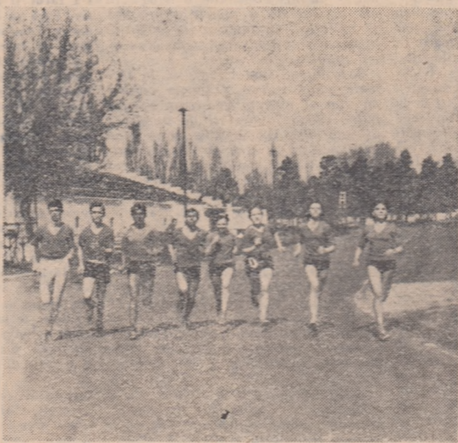
Atleții de la Clubul sportiv școlar la un antrenament pe „Tineretului”

UN PRIM DRUM LA STADIONUL TINERETULUI LA STADIONUL DIN STRADA DR. STAIKOVICI