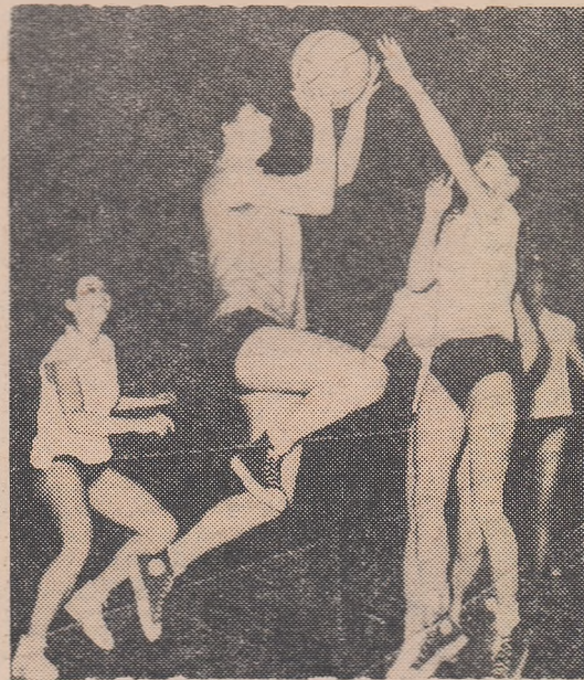
O spectaculoasă aruncare a brașovencei Hergetz. Foză din meciul Voința Brașov — I.C.F.

Politehnica București învinsă de Constructorul și Rapid de Universitatea Cluj!