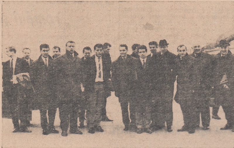
Fotbaliștii selecționatelor Budapestei la sosire pe aeroportul Băneasa.