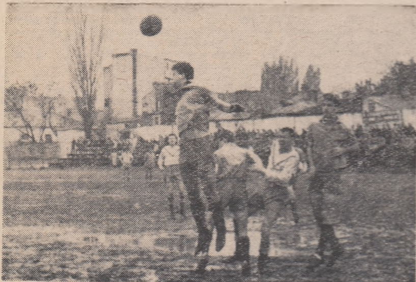
Apărătorii de la Flacăra roșie intervin cu insistență în unul din atacurile Tehnometalului. (Fază din meciul Flacăra roșie București — Tehnometal București 1-0)

ETAPA VIITOARE: Foresta Fălticeni—Victoria Roman; Minobrad Vatra Dornei—Metalosport Galați; Fructex-