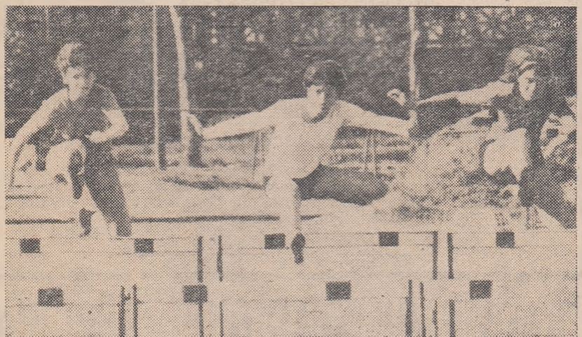
Aspect din cursa de 80 m de la campionatele școlare ale Capitalei

Gh. Ionete (23 Aug) 2:08,6; Suliță: 1. R. Constantin (23 Aug) 50,34 m; 2. Ș. Ionescu (23 Aug) 50,30 m; Înălțime: 1. Fl. Drăguleț 1,75 m; 2. Cr. Georgescu (N. Balc.) 100 m.: 1. E. Milotin (16 Febr) 11,2; 2. T. Iordache 11,4;