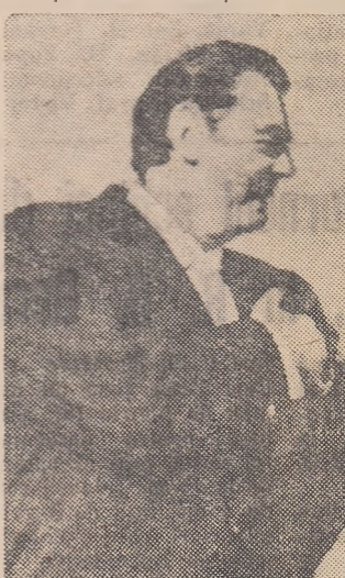
DUPĂ aproape o jumătate de secol doi inoalători celebri, foști recordmani mondiali și olimpici și... rivali s-au întâlnit din nou. Este vorba de americanul Johnny Weissmüller (în stînga fotografiei) și havaianul Pono Kahanamoku. Weissmüller a fost campion olimpic la 100 m liber în anii 1924 și 1928 și recordul său pe această distanță (57,4) a supraviețuit din 1922 pînă în 1934! După 1928 el a devenit actor de cinema, turnînd filmele pline de peripeții și aventuri ale lui „Tarzan”. Kahanamoku a urcat și el pe podiumul olimpic în 1912 și 1920 și a deținut recordul lumii pe 100 m cu 1:00,4.