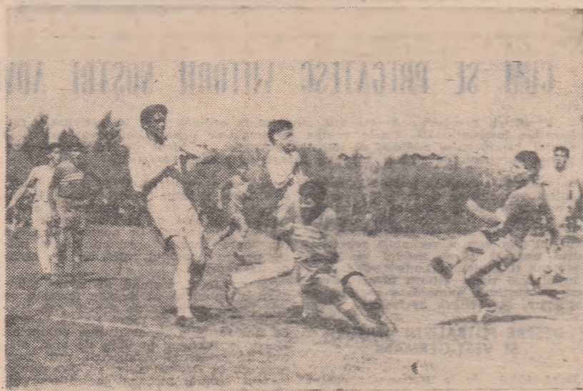
Fază de atac într-un meci de juniori

lectuală și fizică, la cel mai înalt nivel.