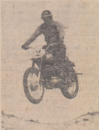
Săritură spectaculoasă. Autor: Eugen Kerestes