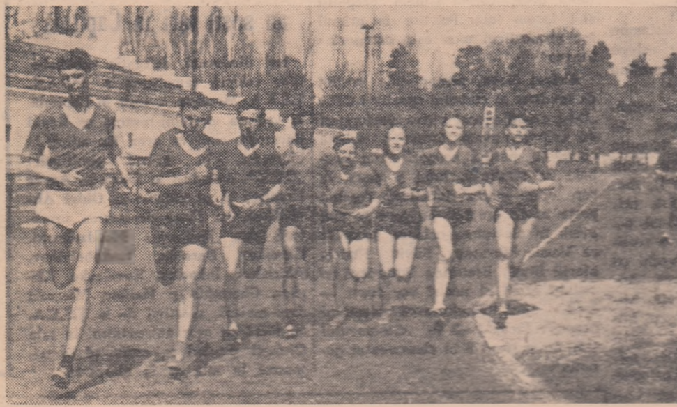
Un grup de atleți de la Școala sportivă de elevi nr. 2 la un antrenament pe pista stadionului Tineretului din Capitală.

● În pauzele dintre reprizele întîlnirilor de rugbi — demonstrații de ciclism și aeromodellism.