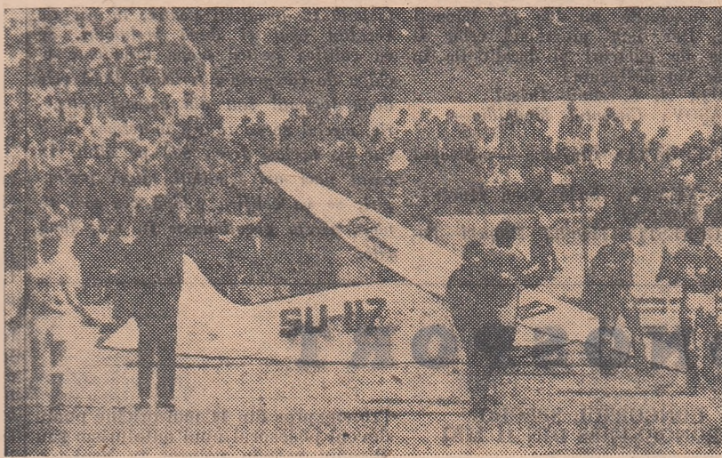
Acest avion a aterizat pe un teren de fotbal! Ineditul s-a produs pe stadionul Arsenal din Tîrsana (R.A.U.), în „deschidere“ la meciul de „cupă“ dintre Zamalek și Tîrsana (2-0). Defectîndu-se elicea, pilotul a fost nevoit să aterizeze forțat cu micul avion de sport „Piper“ pe cel mai apropiat teren favorabil. Din fericire aterizarea nu s-a produs în timpul partidei.