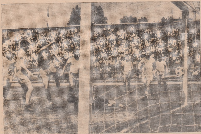
Baboie încheie seria celor șase goluri înscrise de Progresul București în poarta Oltului Rm. Vilcea

Cera mai ușoară ni se pare sarcina echipelor Steaua și Crișul care vor primi replica unor formații care activează în categoria C: Soda Ocna Mureș și, respectiv, A.S. Aiud. Dar, maiștrii... În sfîrșit „regionale”, Metalul Plopeni și Cimentul Medgidia vor forța la... portile sferurilor de finală, încercînd să treacă de Farul Constanța și U. T. Arad.