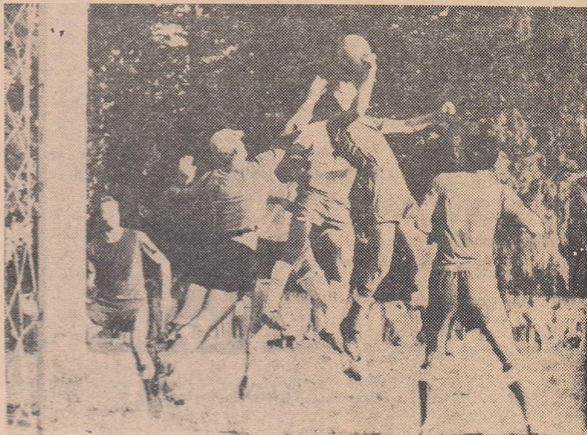
O fază de poartă din derbiul seriei Nord: Progresul Reghin—Steaua roșie Salonta (2-2)

MINERUL ANINA — MUSCELUL CIMPULUNG (2-1). Joc viu disputat. Localnicii au manifestat o superiori-