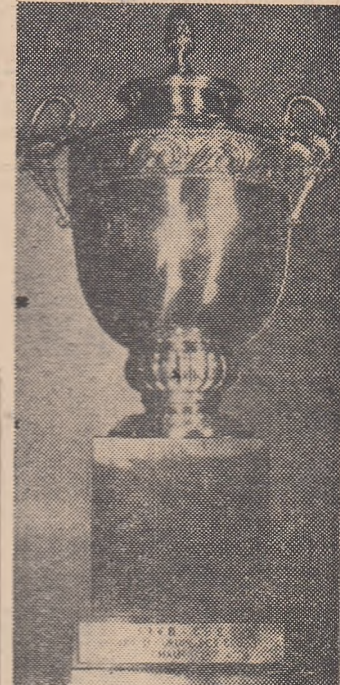
Iată-o! Noua și frumoasa „Cupă a campionilor europeni” e de argint și, împreună cu socul său de marmură neagră, cântărește... 43 de kilograme.

au „descins” marți din avionul venit de la Bruxelles medaliile de aur și de argint, oferite, ca și Cupa, de Comisia Europeană a Federației Internaționale de Volei și care vor