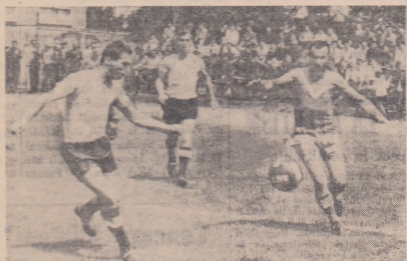
Cocostea, la balon, în cursă spre poartă, urmărit îndeaproape de un apărător advers. (Fază din meciul Tehometal București — I.M.U. Medgidia 0-0).

TEHOMETAL BUC. — I.M.U. MEDGIDIA (0-0). Rezultatul corespunde parții jocului.