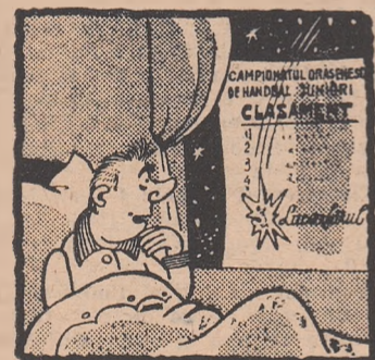
Antrenorul - Cobori în jos lucaful blind... Echipa - Cum să nu cobori cu un asemenea antrenor!