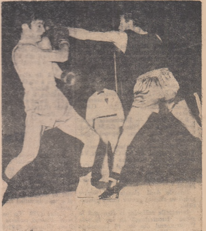
Fază din meciul Stanef (stînga) - Buzuliuc.