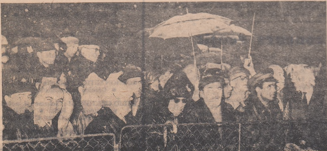
Ploaie... Care mai vesel, care mai supărat, dar nu pleacă nimeni!