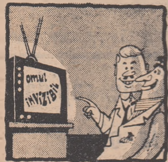
Te pomenesti că e vorba de arbitrul care trebuia să conducă meciul nostru!

Meciul Minerul Motru - C.I.L. Tg. Jiu din campionatul de volei al regiunii Oltenia, n-a putut avea loc deoarece arbitrul delegat nu s-a prezentat la joc.