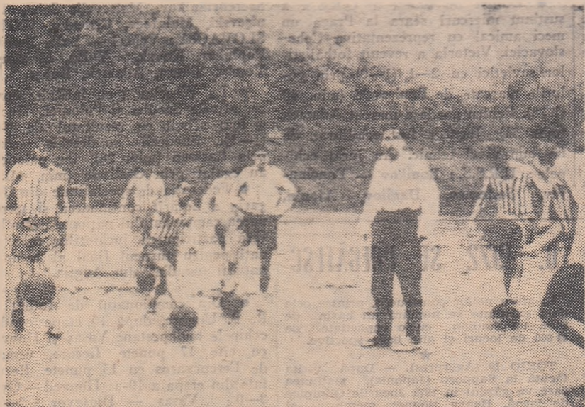
La unul din antrenamentele Minerului Anina.

Alături de C.F.R. Timișoara, autoritarul lider al seriei Vest din categoria C, o altă formație bănețeană are o frumoasă comportare. Este vorba de echipa favorită a muncitorilor din Anina, Minerul, care în returul campionatului n-a cunoscut înfrîngerea. Desigur, a nu pierde 7 etape consecutive constituie o performanță remarcabilă pentru orice echipă și cu atât mai mult pentru Minerul, formație