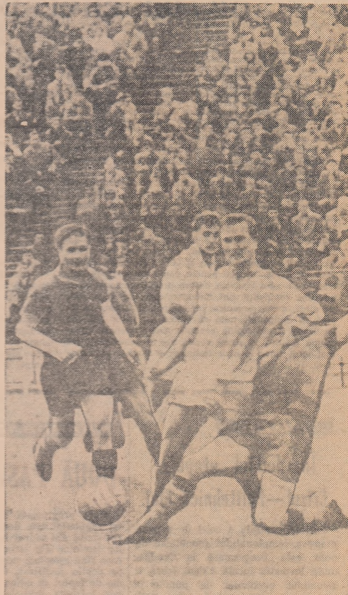
Fază dintr-un meci Dinamo București — U.T.A., disputat în campionatul trecut