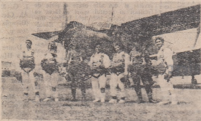
Înainte de decolare...