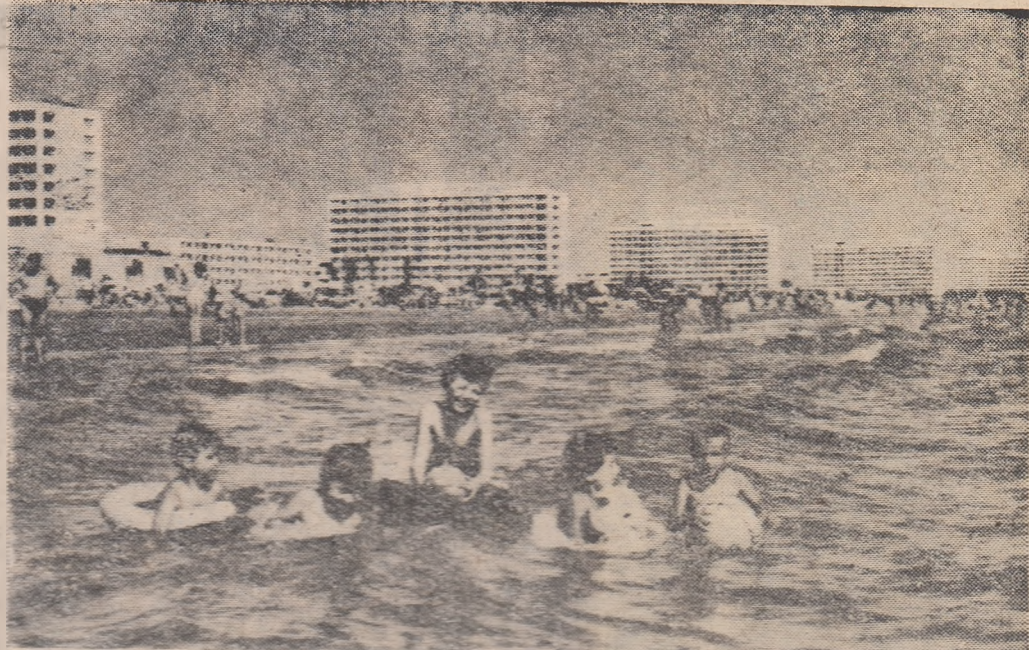
În curînd această imagine va deveni obișnuită pe litoral