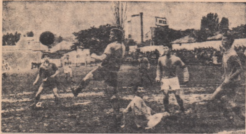
Fază din meciul Flacăra roșie — S.N. Oltenița