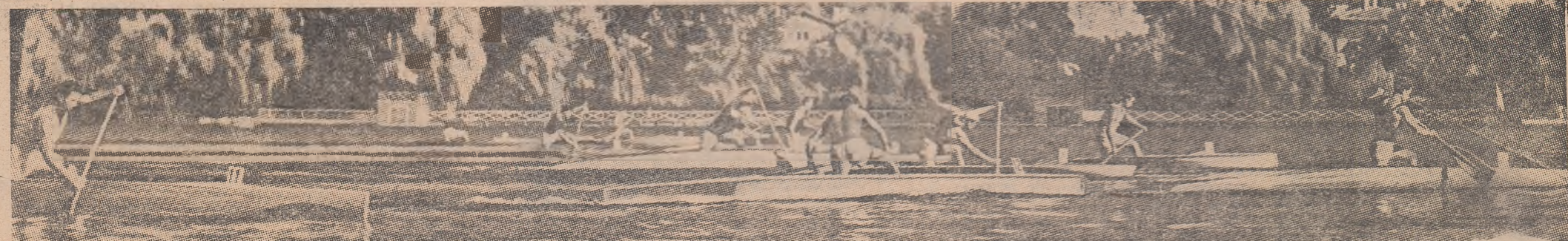
Imaginea — o pledoarie pentru frumusețea probelor de canoe — a fost surprinsă de fotoreporterul nostru P. Romoșan la una din competițiile anterioare. Cu siguranță că înaintea programate sîmbătă, ne vor oieri — ca și la caiac — numeroase asemenea momente spectaculoase

ai întreceri: din cadrul finalelor care sînt programate, azi și miine, astfel: VINERI: ora 9: K 2 (f); K 1 (f) — 5 000 m ora 10: K 4 — 20 000 m ora 17: K 2 — 20 000 m K 1 — 20 000 m SÎMBĂȚĂ, ora 9: C 2 — 20 000 m G 1 — 20 000 m