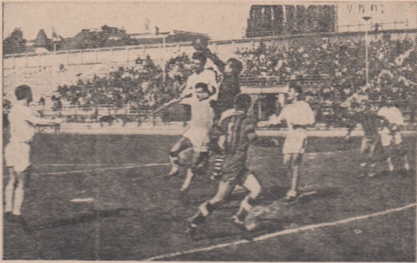
Fază din meciul Știința București — Metalul Tîrgoviște disputat în turul campionatului cat. B

Dar în categoria C? Unul din derbi (C.F.R. Timișoara, în seria Vest) va primi două puncte fără joc, deoarece Minerul Ciomănești nu mai participă la competiție. În schimb, ceilalți trei derbi vor susține partide destul de dificile. Așa de pildă, Unirea Dej (seria Nord) va juca la Sighețul Marmăției cu Forestiera, clasată pe ultimul loc, care are nevoie de puncte pentru... supraviețuire. Chimia